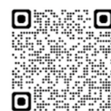
税務職員採用試験概要