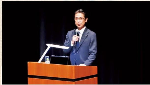
▲国見町の取り組みを紹介する村上町長