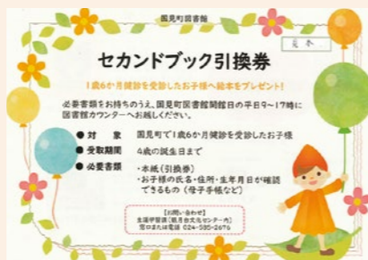
▲セカンドブック引換券