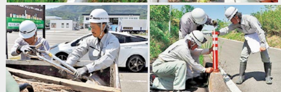
▲現場に向けて資材を準備する ▲現場で施工状況を確認する