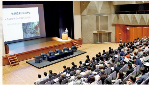
▲サミットの様子に耳を傾ける観衆

5月25日(月)観月台文化センターにて、福島県内で歴史まちづくりに取り組む、会津若松市、白河市、国見町、棚倉町、柳津町の5都市が一堂に会する「福島県歴史まちづくりサミット 2026in 国見」を開催し、約200人が参加しました。