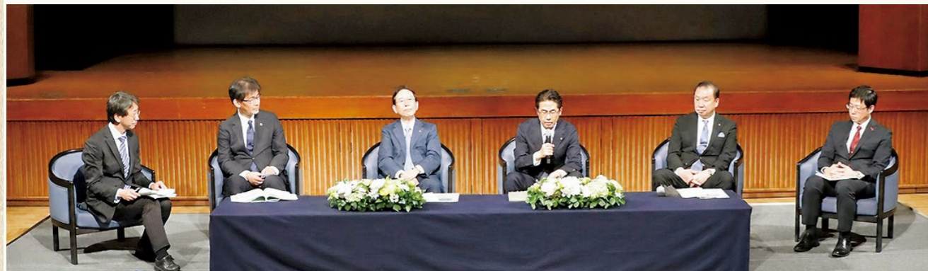
▲白熱したパネルディスカッションの様子

国見町では、歴史まちづくりの取組である「内谷春日神社 太々神楽」の事例を紹介し、地域に根差した祭礼が地域を超えて外部の人たちとの関係が構築されている成功例として報告されました。人口減少等の様々な課題がある中で、今後明るい未来を築いていくために「歴史」と「持続可能なまちづくり」をどう結び付け、どう活用し、どう未来にその価値を創造していくのかを考えるきっかけの場になったのではないのでしょうか。