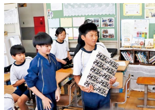
1億円の紙幣見本を手にする児童

租 税教室が5月21日、国見小学校で開催され、6年生の児童たちが税金の役割や大切さについて学びました。町税務課の職員が講師を務め、税金の使い道や暮らしとの関わりを分かりやすく説明しました。会場では1億円分の紙幣見本も披露され、児童たちは「重い!」と驚きながら、税を身近に感じ理解を深めていました。