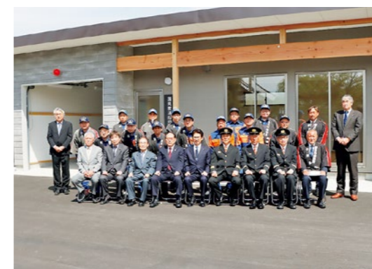
新たな屯所の前で記念撮影する関係者の皆さん

直売所「くにみ市場」の令和7年度売上額は8億5,349万円となり、昨年度の過去最高額を大きく更新しました。