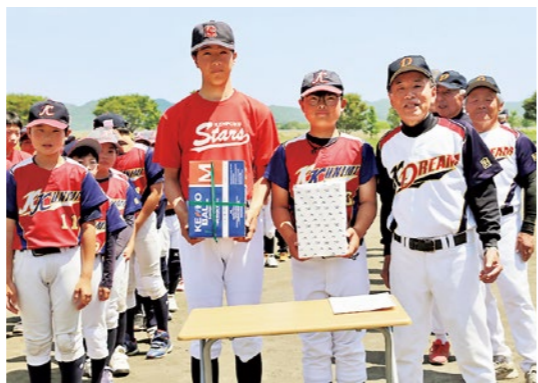
ボール贈呈式の様子

国 見ドリームクラブは5月17日、徳江グラウンドで国見ソフトボールスポーツ少年団と県北スターズスポーツ少年団へボールを贈呈しました。国見ドリームクラブは、公共施設の清掃活動など地域貢献活動に積極的に取り組んでいます。今回は、地元で頑張る子どもたちを応援したいとの思いから贈呈が行われ、子どもたちは笑顔でボールを受け取っていました。