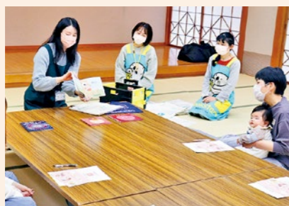
▲ブックスタートのようす

1歳6ヶ月児を対象に、絵本をプレゼントする「セカンドブック」をはじめます。3ヶ月児を対象とした「ブックスタート」を補完し、イメージや言葉を育む最適な時期に、親子で心触れ合うひと時を共有するきっかけづくりに。対象の方には「引換券」をお送りしますので、図書館においでください。