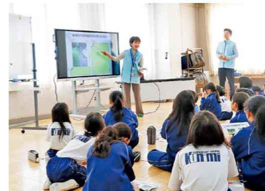
行政相談の事例を紹介する町行政相談員

川 内消防屯所建築落成式が4月19日、川内集会所で行われました。老朽化していた消防屯所と川内水防倉庫に代わり、屯所と水防倉庫を一体化した新たな屯所が完成しました。落成式後の内覧会では、消防団員ら参加者が施設内を見学し、新たな拠点の完成に、地域防災への決意を強くしていました。