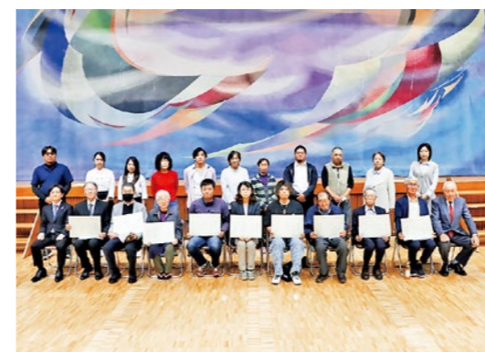
表彰を受けた優秀出荷組合員の皆さん