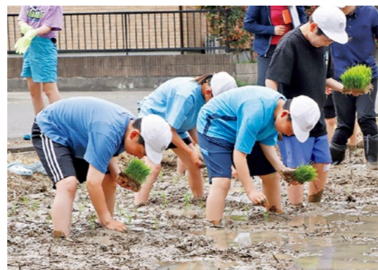
丁寧に田植えする児童たち

当日は、小坂アグリ株式会社や県北農林事務所伊達普及所、JAふくしま未来国見営農センターの協力のもと、児童たちは農業の大変さなどを肌で感じ、ひとつひとつの天のつぶの苗を丁寧に植えていました。秋には育った苗の稲刈り体験が予定されています。