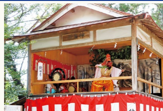
神楽奉納 演目「猿田彦」