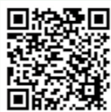
観月台文化センター HP

国見町青少年育成町民会議では、次世代を担う青少年の健全育成を推進するため、芸術及び文化活動並びにスポーツ活動の各区分において、すぐれた成績をおさめた青少年または青少年団体に対し、奨励金を交付しています。詳細は観月台文化センター HP をご覧ください。