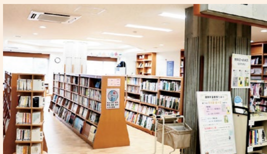
◀ 国見町観月台文化センター内