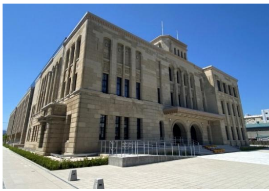
会津若松市 市役所本庁舎旧館