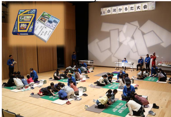
白河の歴史・伝統・ 文化への理解を深める 「白河かるた」の取組