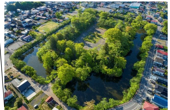
棚倉町 棚倉城跡(国史跡)