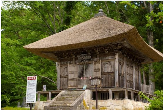
柳津町 奥之院弁天堂 (国重文)