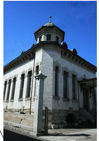
国見町 奥山家住宅洋館(国登録)