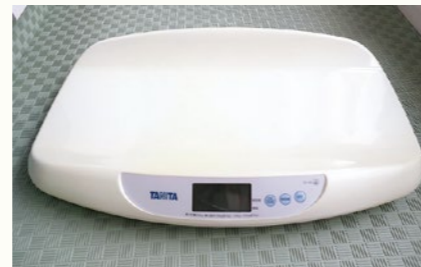
こちらを貸し出します