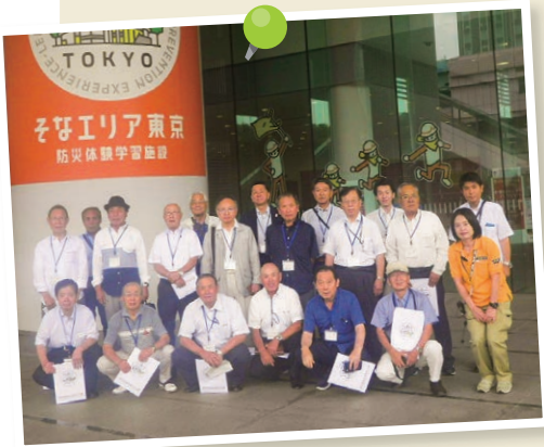
東京臨海広域防災公園にて

一度限りの人生を楽しく生活しようと思っても語り合う町内会ですが、この頃は価値観の多様化やスマホの普及により対人関係が希薄になってきたように思います。それでも、人情味のある挨拶は気分を和ませます。思うようにいかない世の中ですが、会話の持つ意義は大きく、前向きな考え方を共有できる会話は、誰しも心が弾むと思います。町の人口が減少する中で、良好な人間関係を大切にしたいです。 町の活動も、もっと町民との会議や対話の機会を増やし、町民の意識向上や行