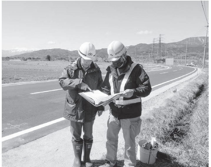
専門的知識を持つ人材の確保を！