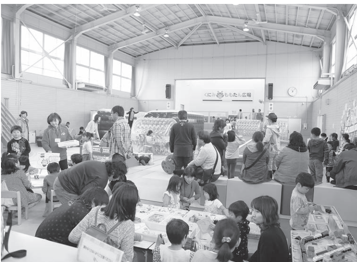
くにももたん広場

村上町長 子育て世帯の利用者が多く、交流人口の創出の重要性を鑑みて、現時点では、財源を確保しながら継続する。