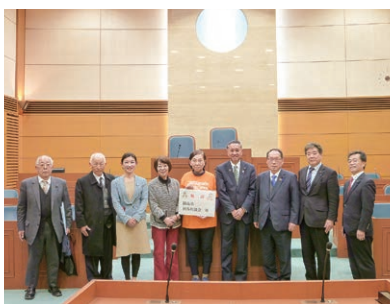
山北町役場議場にて