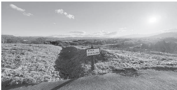
阿津賀志山防壁 (国道4号北地区)