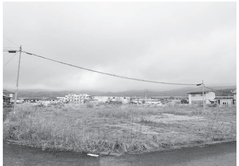
再開発が期待される町有地