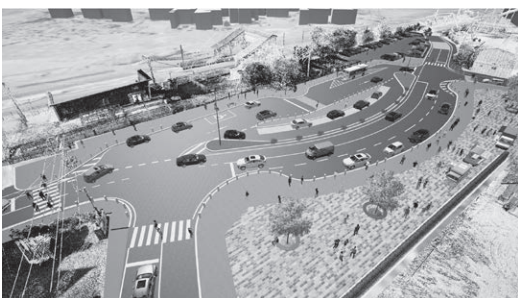
藤田駅前ロータリーイメージ図

その上で、いつ頃までにまちの駅を作ろうと考えているのか伺う。 村上町長 全体のスケジュールについて、今後検討していく。