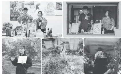
地域おこし協力隊

域おこし協力隊の中にはまちづくりに興味があり、携わりたい方を含めて連携できる部分は多々あると思われる。