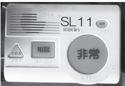
緊急通報システム

な事業が推進されている。周知徹底を図るべく一覧表にして各戸に配布していただきたいが所見を伺う。