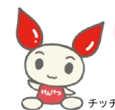
献血キャラクター けんけつちゃん