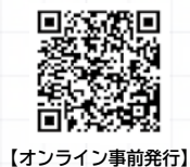
【オンライン事前発行】