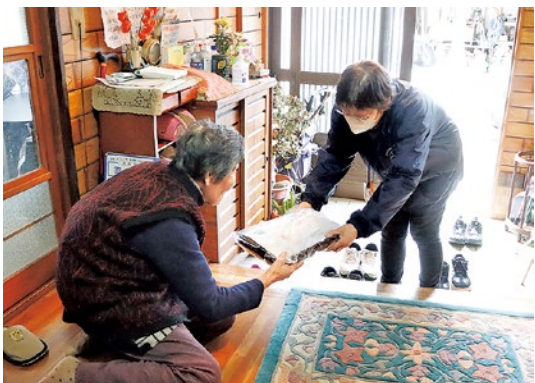
おいしいおせちを食べて良いお年を

用意した231食のおせち料理は、各地区の民生児童委員が一軒ずつ訪問し手渡されました。おせちには国見小学校の児童らが書いた年賀状が添えられ、子どもたちのまごころも一緒に届けられました。