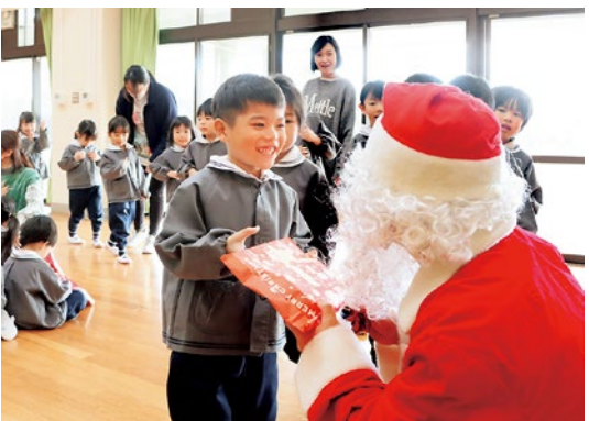
サンタさんからのクリスマスプレゼントに笑顔が溢れる

くにみ幼稚園で12月18日、12月生まれの園児たちの誕生日会の後、サプライズでサンタクロースが登場しました。赤い衣装のサンタさんが姿を見せると、園内は歓声に包まれ、園児たちは目を輝かせて大喜び。サンタさんから園児一人ひとりに、一足早いクリスマスプレゼントが手渡され、笑顔あふれるひとときになりました。