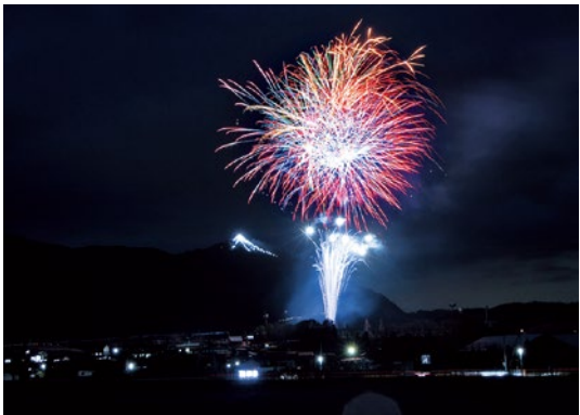
夜空を彩るあつかし山ビッグツリーと打ち上げ花火

今年で33回目を迎えた「あつかし山ビッグツリー」の点灯式が12月21日、道の駅国見あつかしの郷で行われました。関係者が一斉に点灯スイッチを押すと、光の粒で縁取られた阿津賀志山のシルエットが浮かび上がると同時に、約100発の色鮮やかな花火が打ち上げられ、夜空を彩りました。ビッグツリーは、町建設業協会の皆さんにより設営されており、国見の冬の風物詩となっています。