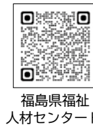
福島県福祉人材センターHP