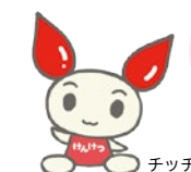
献血キャラクター けんけつちゃん