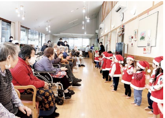
手遊び歌を披露する子どもたちと手拍子をする利用者の皆さん

子どもたちの歌声が響き渡る中、施設の利用者たちは手拍子をしたり、一緒に口ずさんだりする姿が見られました。小さなサンタさんからのクリスマスプレゼントに、施設中が笑顔であふれていました。