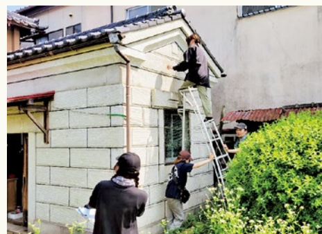
▲大学生による調査の様子