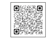
伊達地方消防組合HP