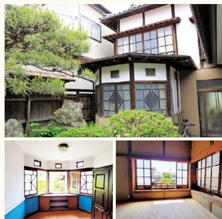
▲熊谷家住宅離れ外観（上） 1階洋室（左下）、2階座敷（右下）

1階は八角形の出部屋が特徴的な洋風仕様で、診察室としても使われました。2階は、座敷の客間となり、窓からは藤田の街並みを眺めることができます。