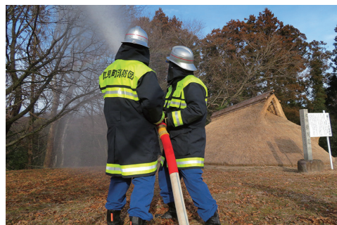
岩淵遺跡での訓練の様子