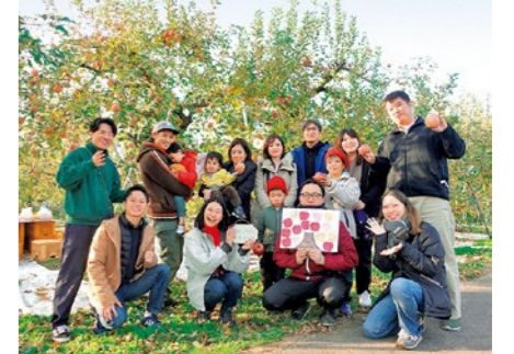
2年目となるりんごの木オーナー制度「収穫体験」の様子