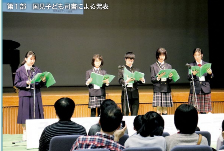
第1部 国見子ども司書による発表