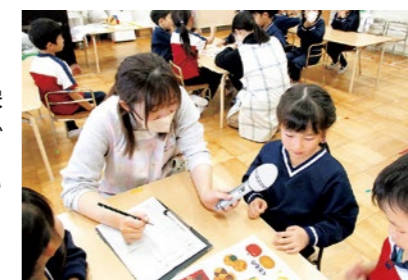
「おやつについて考えよう」(年長児)

町では食生活改善推進員の皆さんと栄養士が出向いて、くにみ幼稚園の子どもたちを対象に食育教室を開催しています。12月の食育内容を紹介します。