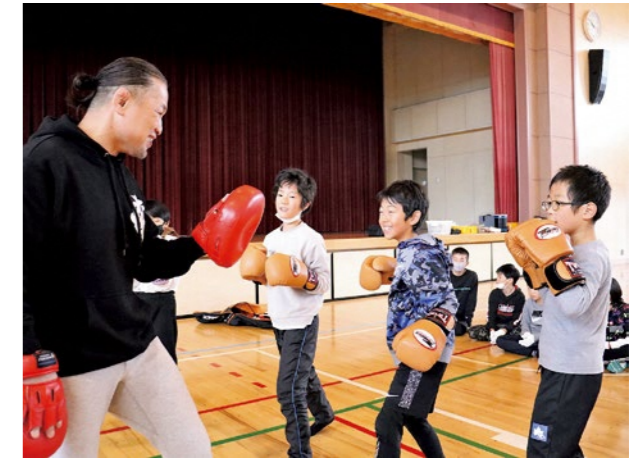
▲グローブを着けてミット打ち体験

国見町教育委員会生涯学習課(観月台文化センター) ☎ 585-2676 Fax585-2707 E-mail: shogai@town.kunimi.fukushima.jp