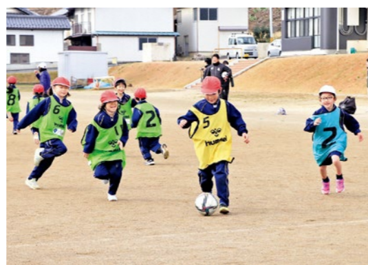
寒さに負けず元気にサッカーをする子どもたち

参加した子どもたちからは「時間が短い」「もっとサッカーをやりたい!」といった声が聞かれるなど大好評でした。