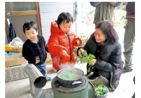
毎月、農業体験や周遊ツアーの受け入れをしています