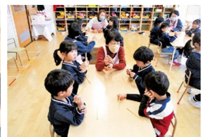
「正しい箸の持ち方について」(年中児)