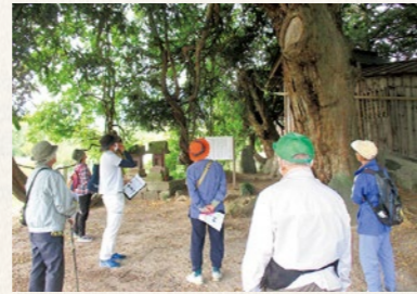
深山神社の大カヤ・大藤

史跡の現地の雰囲気を感じ取れるように、さまざまな仕掛けがされていますので、まだ体験したことのない方はぜひ体験してみてください。