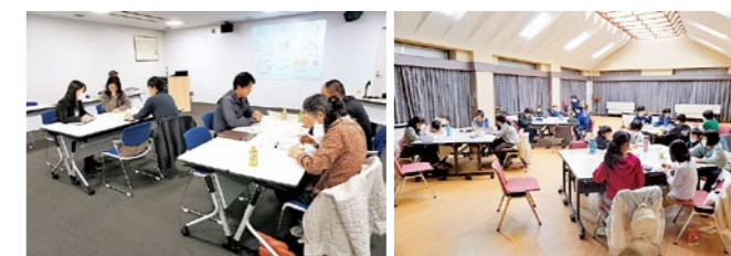
▲検討委員会の様子