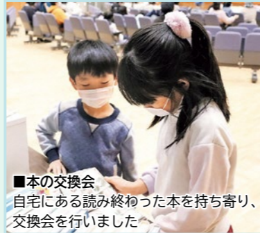
■本の交換会 自宅にある読み終わった本を持ち寄り、交換会を行いました。