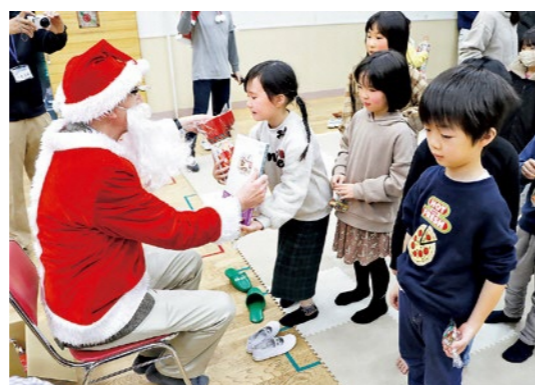
サンタさんからプレゼントを受け取る子どもたち

リトルオリーブこども基金のクリスマス訪問が12月16日、子どもクラブで行われました。「リトルオリーブこども基金」は、被災地の子どもたちを支援する団体で、訪問は昨年引き続き行われました。絵本の読み聞かせや宝探しゲーム、クリスマスプレゼントの贈呈など、子どもたちの思い出に残るクリスマス会となりました。プレゼントは藤田保育所、くにみ幼稚園の子どもたち全員にも用意され、後日配布されました。