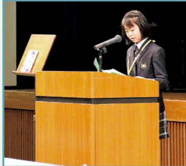
▲マンガ de バトル「葉屋のひとりごと」