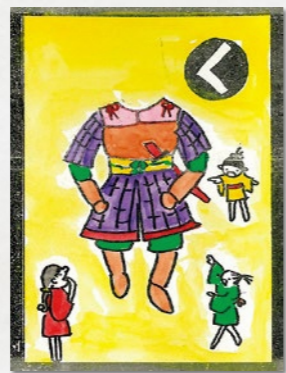
【第九回】 俵藤太秀郷と平将門