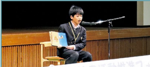
▲絵本の読み聞かせ「おだんごダイブ」