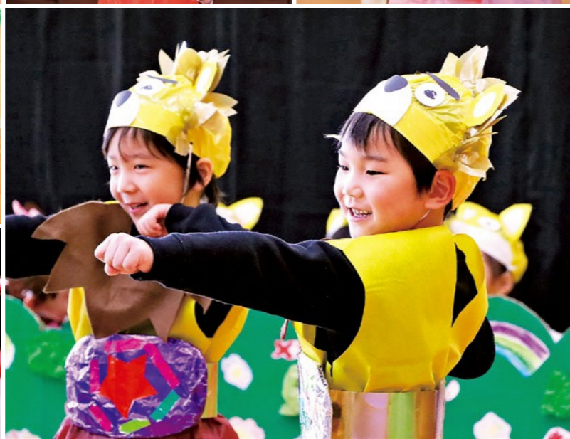
2023.12.02 く にみ幼稚園生活発表会