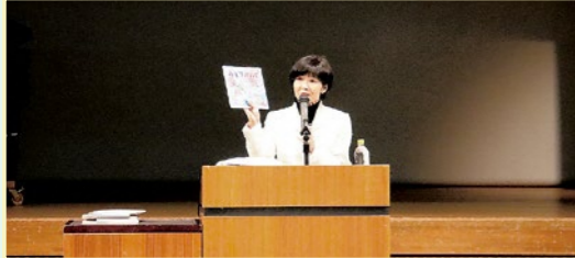
▲絵本の朗読や読書活動推進の取り組みを講演