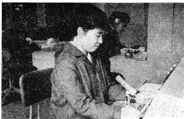
【奥協有線放送室スタッフ】

国見町種子生産組合(組合長は町長、組合員四〇名)では、昭和三十八年設立以来、年々多量の優良たねもみを生産し、これを県内に配給してその実績は高く評価されてきた。ここの国及び県から特段の指導と援助を受けて近代の機械を導入し、共同積選、分別、包装はもちろん、水分測定、排草まで一連の装置を備えた機械室と低温貯蔵庫を設置することになり、このほど森江野支所前に写真のような建物の上棟式が行われた。機械装置三五〇万円、機械装置冷蔵室一五〇万円、種子貯蔵冷蔵室三〇〇万円の計八〇〇万円の事業で、国内より四〇〇万円、県より二〇〇万円の補助を受け、残り二〇〇万円が事業主体負担となっている。本年度は全国で五か所のうちのひとつが町に指定されたので、これも組合結成以来の実績が買われてこの特典に浴したものといわれたい。