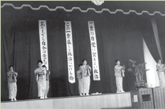
▲明るく正しい選挙の歌「すっきり音頭」を踊る様子

この集いでは、女性として必要な政治や健康管理の問題について講師を招き勉強しました。特に目の前に