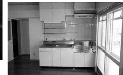
十分な広さのキッチン