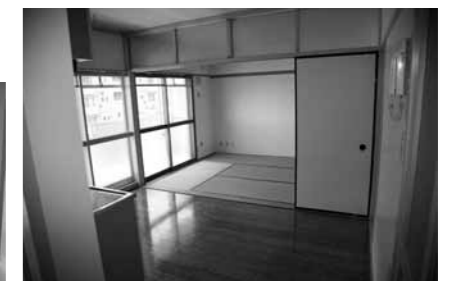
連続して使える台所と和室

定住促進住宅は、商店街と国道4号線の間で立地し、通勤・通学や買物など生活のために便利な場所に立地しています。JR藤田駅や公立藤田総合病院も徒歩の圏内です。