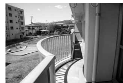
日当たり良好なバルコニー