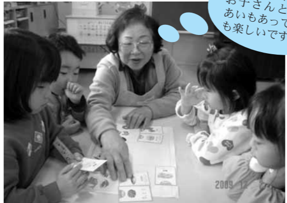
藤田保育所での食育教室の様子