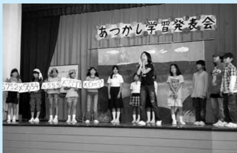
大木戸小 10月17日 4・5年劇「対決! たんけん島」