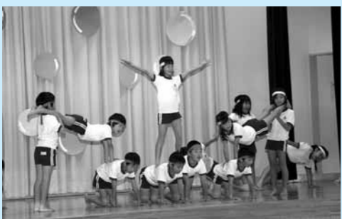
森江野小学校 11月7日 3年体育「ハッスル・ミュージカル」