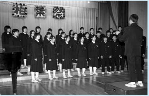
奥北中学校 11月12日 合唱コンクール 2年3組「君とみた海」