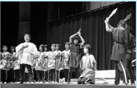
藤田小 10月17日 6年劇「友のために」