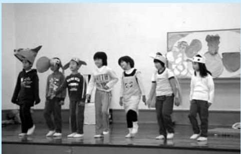
小坂小学校 10月31日 1年劇「サラダで元氣」