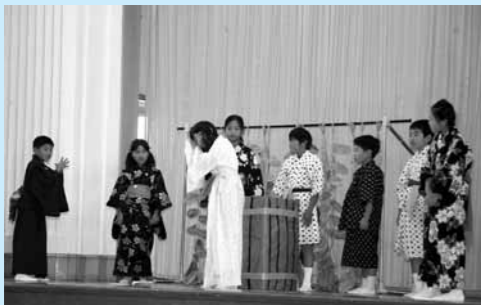
大枝小学校 10月24日 4年喜劇「ゆうれい血屋しき」