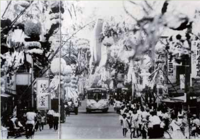
写真は七夕の飾りがされた華やかな本町大通り。人々がにぎわう通りの右側には佐川金物店の看板、左側には国見の銘菓松屋羊羹の大きな看板が見える。

戦後の混乱も、昭和30年ころにはようやく復興し、神武景気とも呼ばれた。好景気を迎えた藤田の商店街も好況を呈し、市街地を通る国道も舗装された。