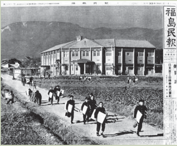
写真説明：昭和33年1月1日付け福島民報（一面）

その後、東大枝地区は、経済、社会の両面の交流の深いことを理由に昭和29年7月6日梁川町への編入が決定しました。