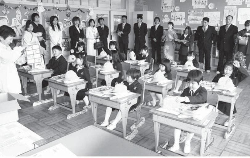
森江野小学校新1年生